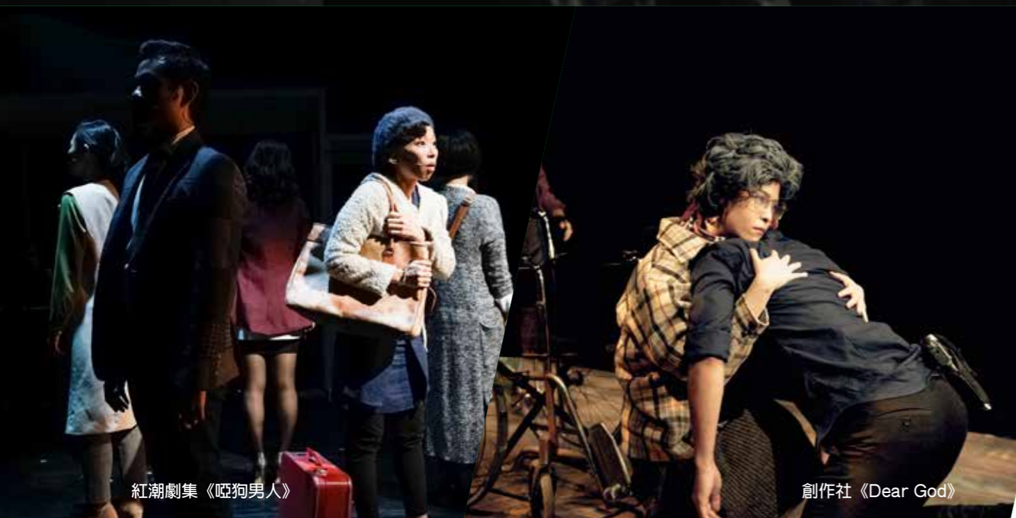
紅潮劇集《啞狗男人》