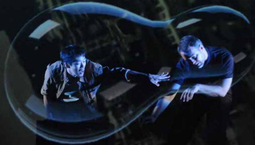
狼劇場《臺北·哥本哈根》