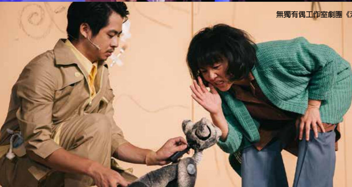
無獨有偶工作室劇團《洋子 Yoko》