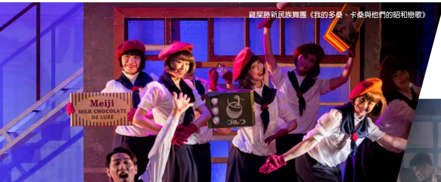
雞屎藤新民族舞團《我的多桑、卡桑與他們的昭和戀歌》