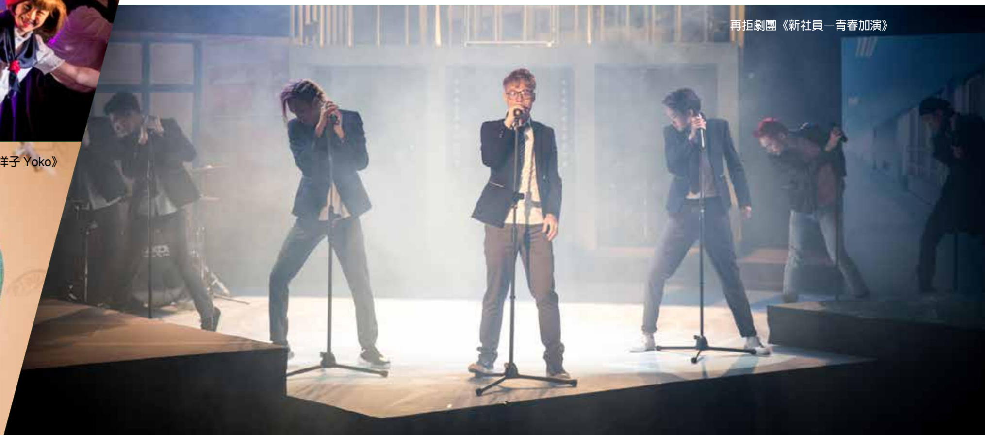
再拒劇團《新社員—青春加演》