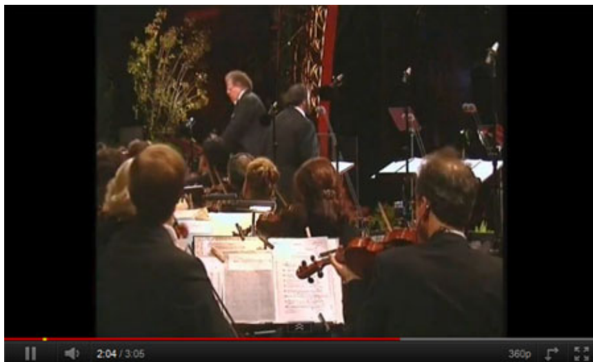
Pavarotti "nessun dorma"